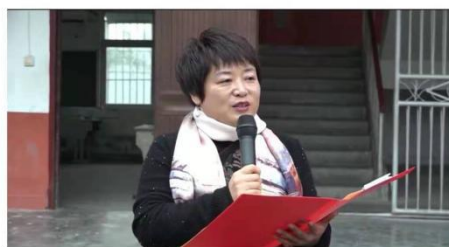
图 11 我院教师作为永城市“全民阅读推广大使”参加“阅读进校园·书香润永城”活动