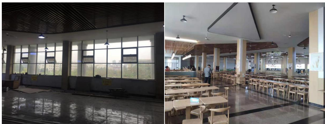
图 2 我院餐厅改造前后