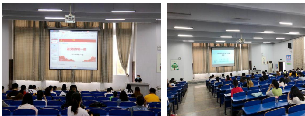
图 15 我院开展“返校复学第一课”教育活动