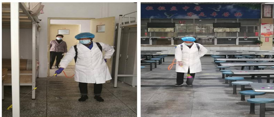
图 12 我院后勤处指导物业公司对宿舍、餐厅消毒

在疫情防治普及方面，我院积极利用网络媒体进行宣传。通过校园网、微信公众号等发布《致永城职业学院全体学生的一封信》、《致全体教职员工的一封信》、《疫情防控工作提醒卡》《致全院各级团组织、团员和青年倡议书》等，开展“万众一心战疫情”活动，面向全体师生宣传普及疫情防治和防控要求，形成科学应对、众志成城抗击疫情的良好氛围。其中录制的“为武汉加油”视频，被多家网络媒体转发。