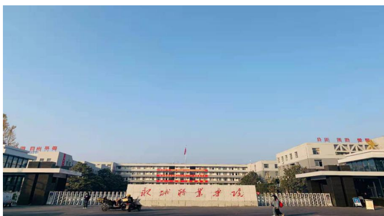
图 1 我院大门改造前后