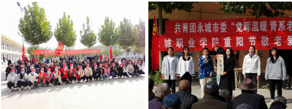
图 10 我院志愿者走进敬老院开展敬老爱老活动