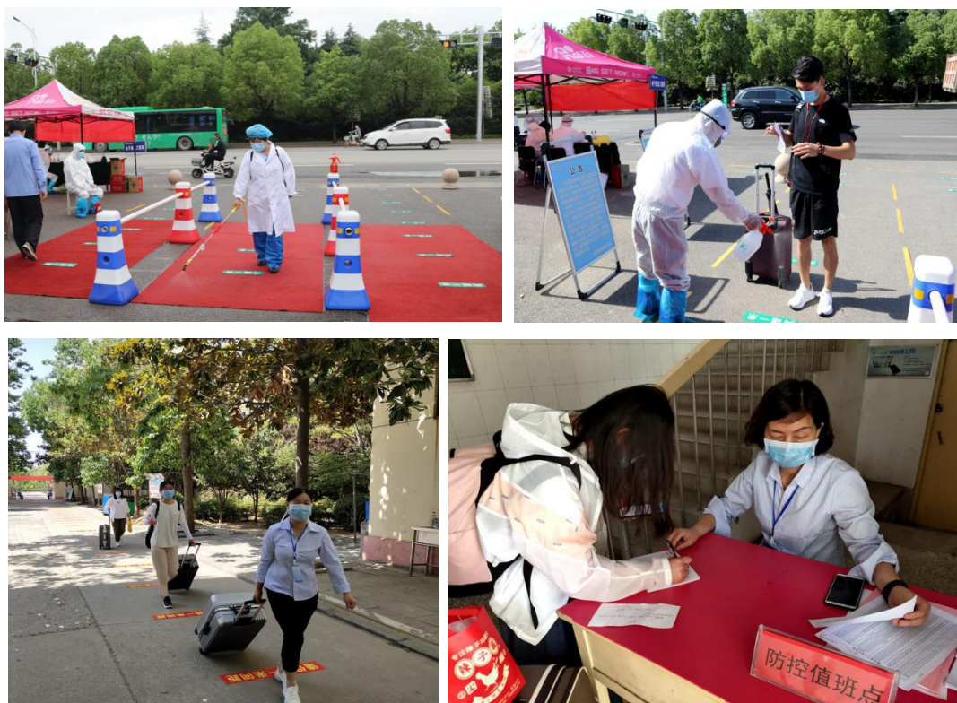
图 14 我院首批返校复学学生入校掠影