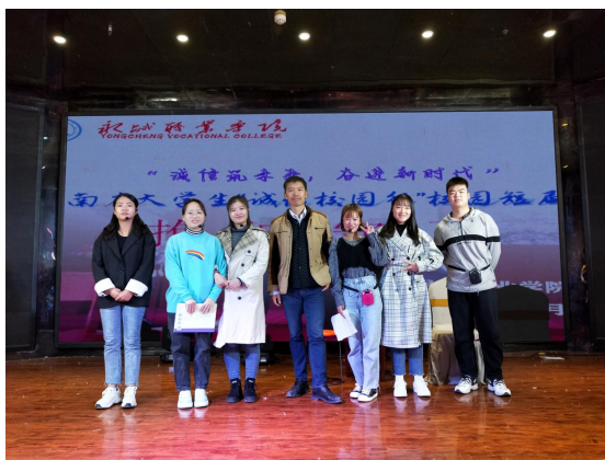
图3 我院组织开展“诚信筑未来，奋进新时代”比赛

为了更好地达到资助育人目的，我院学生资助管理中心老师根据大赛活动精神，对《抱诚守信》短剧剧本进行了优化，并在短剧内容中添加了“疫情”元素，同时在原文化艺术系代表队的基础上，重新招募了短剧演员，组成了实力较为强劲的复赛参赛队伍，代表我院参加河南省大学生“诚信校园行”校园短剧大赛的复赛。