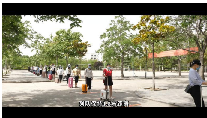
图 13 我院组织拍摄“学生返校复学演练”视频