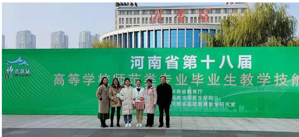
图5 我院师生参加河南省第十八届高等学校师范类专业毕业生教学技能大赛