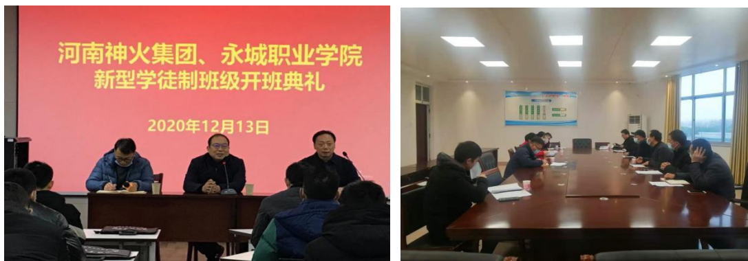
图 7 我院与河南神火集团开展新型学徒制培训合作

为充分利用学院优质的教育资源，进一步发挥学院职业教育专业优势，借“政、校、企”合作的有利机遇，学院培训部积极发挥社会服务功能，承担企业员工职业技能培训、岗位技术培训教育工作。2020 年，我院与豫永驾校合作开展驾驶员培训，为学院创收 23 万余元。另外，我院与河南神火集团签订了新型学徒制培训合作协议，2020 年 12 月在神火集团培训中心举行了开班典礼，目前第一期 209 人培训正在进行中，预计为学院创收 50 万余元。