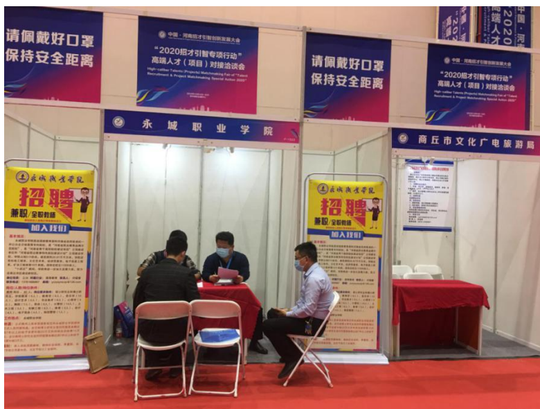
图 6 我院参与“招才引智”活动，招聘急需人才

2020 年 10 月学院积极参与商丘市委市政府“招才引智”活动，引进急需人才。根据《关于转发豫人社办〔2020〕83 号文件创新事业单位引才机制开辟招才引智绿色通道的通知》（商人社办〔2020〕105 号）、《事业单位人事管理条例》、《河南省事业单位公开招聘工作规程》等有关规定，学院积极参与商丘市委市政府“招才引智”活动，收集应聘人员报名信息 477 份，经初步审核通过 338 人，现场审核通过 104 人，面试通过 55 人，体检通过 52 人，最终学院引进硕士研究生 49 人。