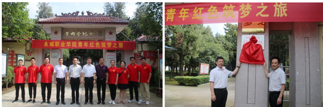
图9 我院我院与鲁雨亭纪念馆开展爱国主义教育基地共建活动

为深入学习贯彻习近平总书记给复旦大学《共产党宣言》展示馆党员志愿服务队全体队员回信精神，7月28日上午，我院暑期“三下乡”青年红色筑梦之旅服务团前往永城市鲁雨亭纪念馆，举行永城职业学院爱国主义教育基地揭牌及参观学习活动。在活动中，大家参观了纪念馆，全体党员在鲁雨亭雕像前重温了入党誓词。今后，我院将与纪念馆加强联系，用好这一思政教育重要阵地和生动课堂，定期组织团员青年开展爱国主义和革命传统教育，全面提升学院育人水平。